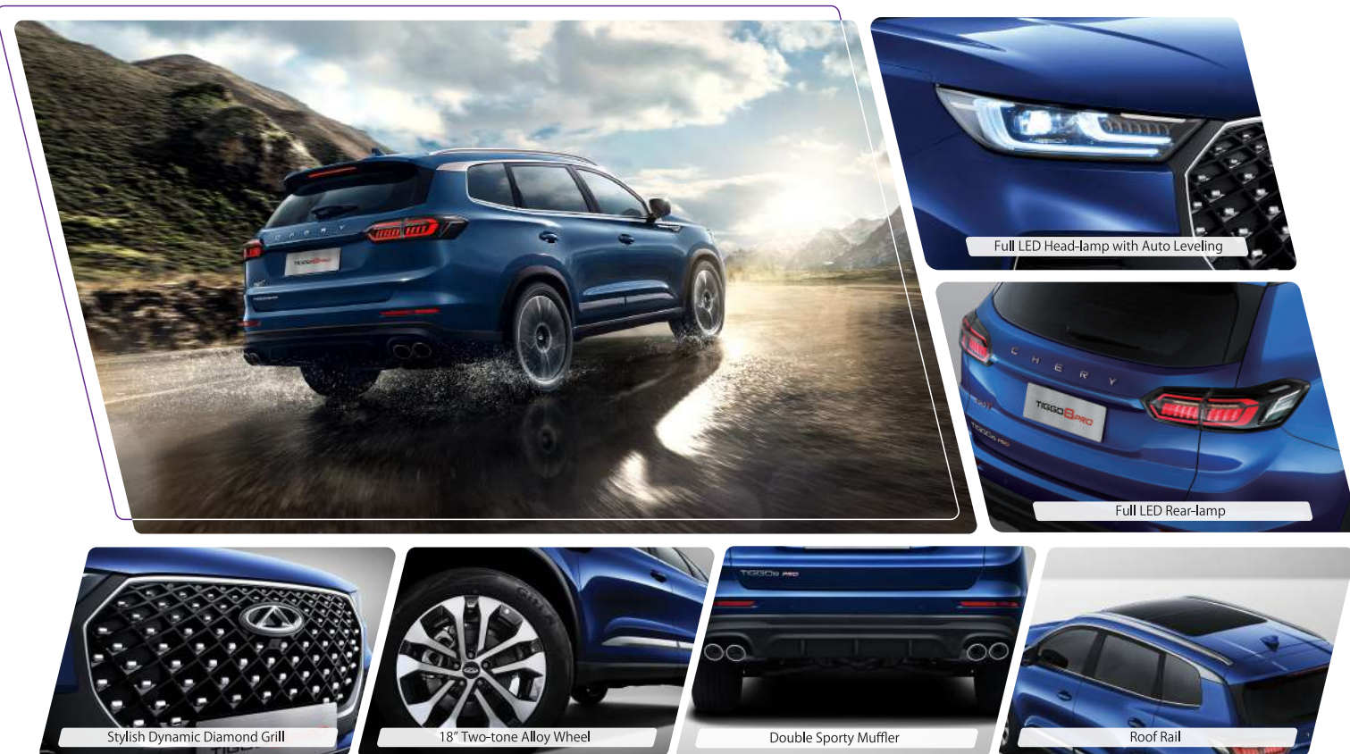
Full LED Head-lamp with Auto Leveling

Menghadirkan desain premium di Tiggo 8 pro, membuat Anda percaya diri dalam setiap perjalanan. Anda akan tampil lebih percaya diri dan mendapatkan pengalaman yang fantastis.