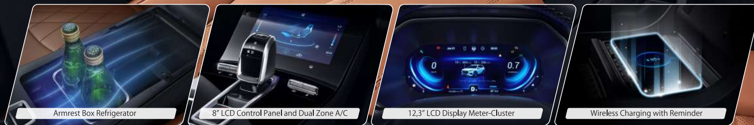
Armrest Box Refrigerator

Pada Cabin Tiggo 8 Pro dilengkapi dengan 10.25 HD Capacitive Display Audio yang dapat terkoneksi dengan Android Auto, Apple Car Play, Bluetooth dan USB. Dengan didukungnya berbagai teknologi canggih yang ada, membuat perjalanan Anda lebih menyenangkan.