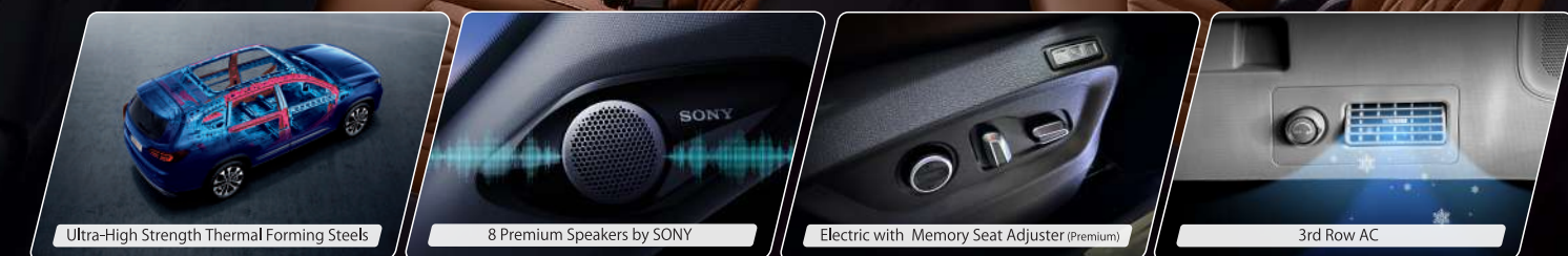
Ultra-High Strength Thermal Forming Steels

Ruang interior yang luas di Tiggo 8 Pro memiliki 7 kursi yang nyaman dan berkualitas tinggi. Pada kursi depan dilengkapi Flexible Headrest yang menyangga bagian kepala dengan lebih nyaman. Untuk urusan keselamatan Tiggo 8 Pro dilengkapi dengan first class safety features demi menjaga keselamatan saat berkendara.